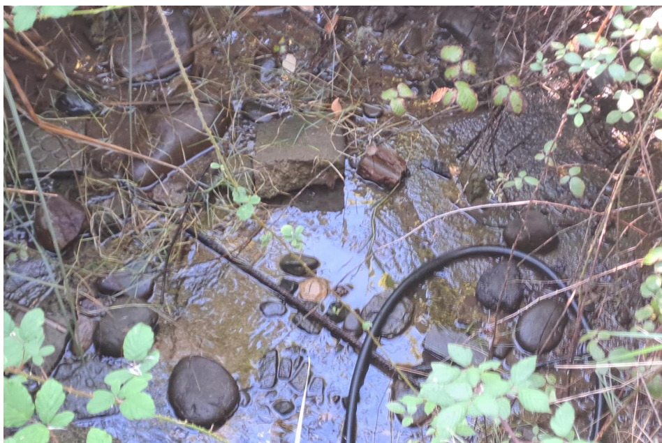
Imagen del fondo del pozo